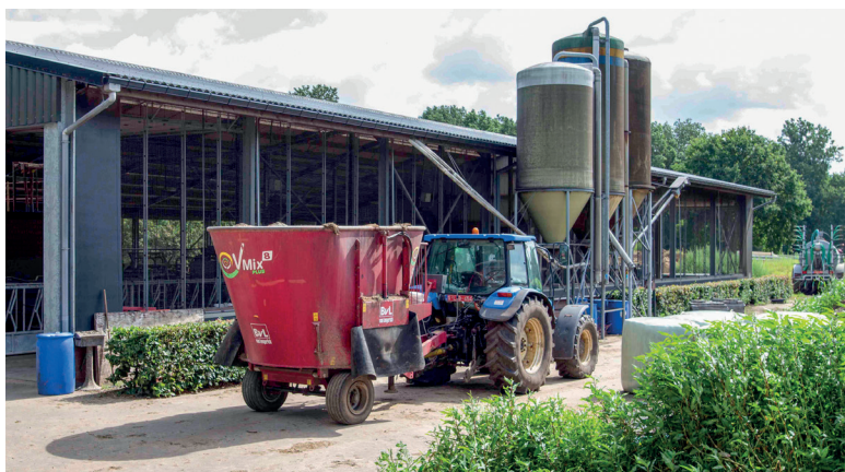
De melkveehouder houdt een ruwvoorraad van een jaar aan