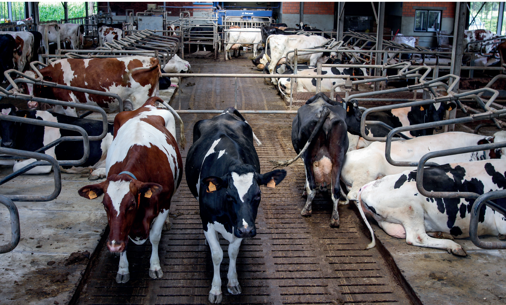
De koeien worden gemolken met een melkrobot

Vruchtbaarheid is daarom een van de aandachtspunten bij de stierkeuze. Ook de melkkoeien scoren met gemiddeld 2,5 inseminaties niet goed, vindt De Schutter. 'Mindere koeien, die na twee pogingen niet drachtig zijn, insemineer ik met brown swiss. Ik heb de indruk dat de koeien dan makkelijker drachtig worden en bovendien heeft het geen impact op de melkgift.'