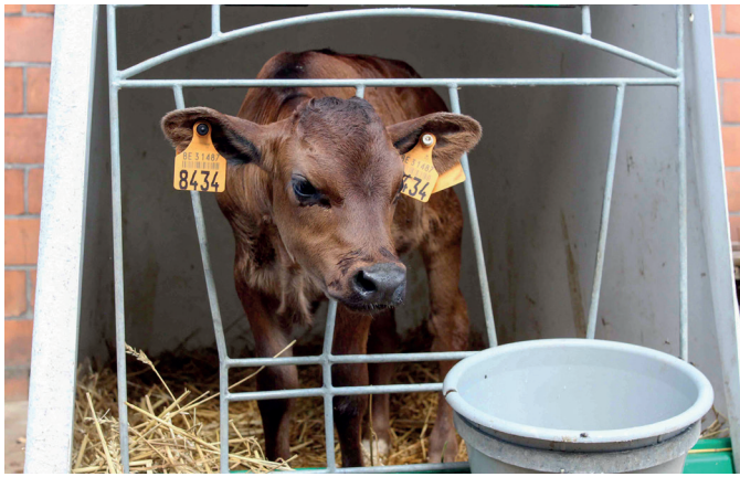
De veehouder wil in de toekomst minder jongvee aanhouden