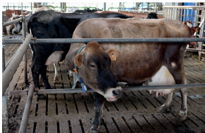
Na twee inseminaties met holstein kiest De Schutter voor brown swiss

Om de vruchtbaarheid te verbeteren, probeert hij ook wat te sleutelen aan het droogstandsrantsoen om te zorgen voor een hogere drogestofopname tijdens en na de droogstand. 'Door het kleine aantal dieren was het soms moeilijk om gemengd te voeren. Nu gebruik ik mengbalen om ook kleine aantallen dieren een correct rantsoen te kunnen geven', verklaart hij.